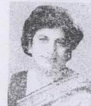
Prof. Kiran Walia Hon'ble Minister of Social Welfare, Govt. of Delhi