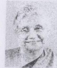
Smt. Sheila Dikshit Hon'ble Chief Minister, Delhi

Document required : Proof of Residence of Delhi.