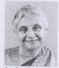
श्रीमती शीला दीक्षित माननीया मुख्यमंत्री, दिल्ली

जरूरी दस्तावेज : दिल्ली में निवास का प्रमाण